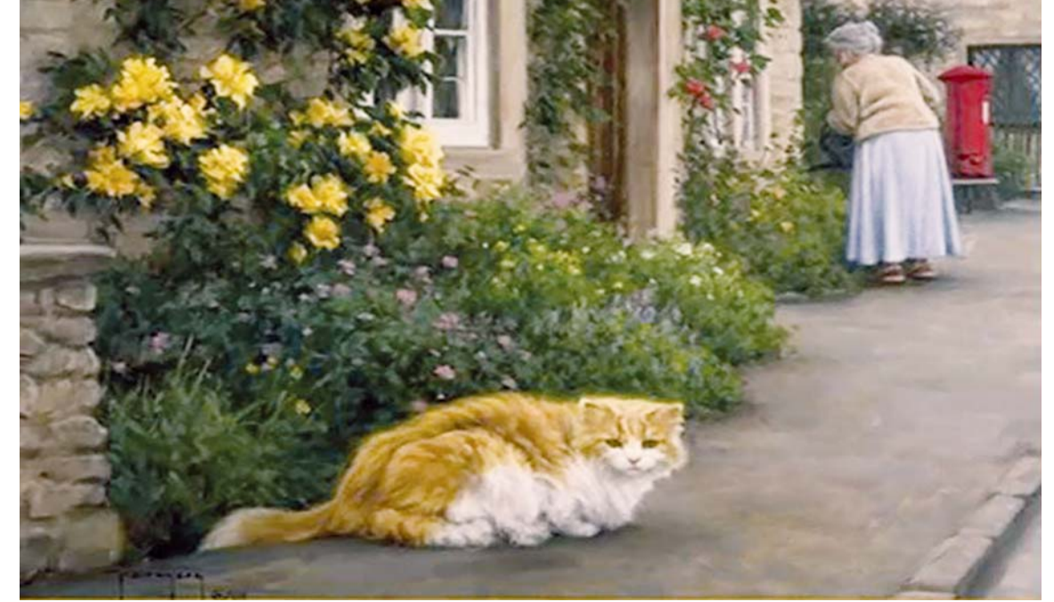
« اثری هنری از "رابرت دانکن" نقاش آمریکایی