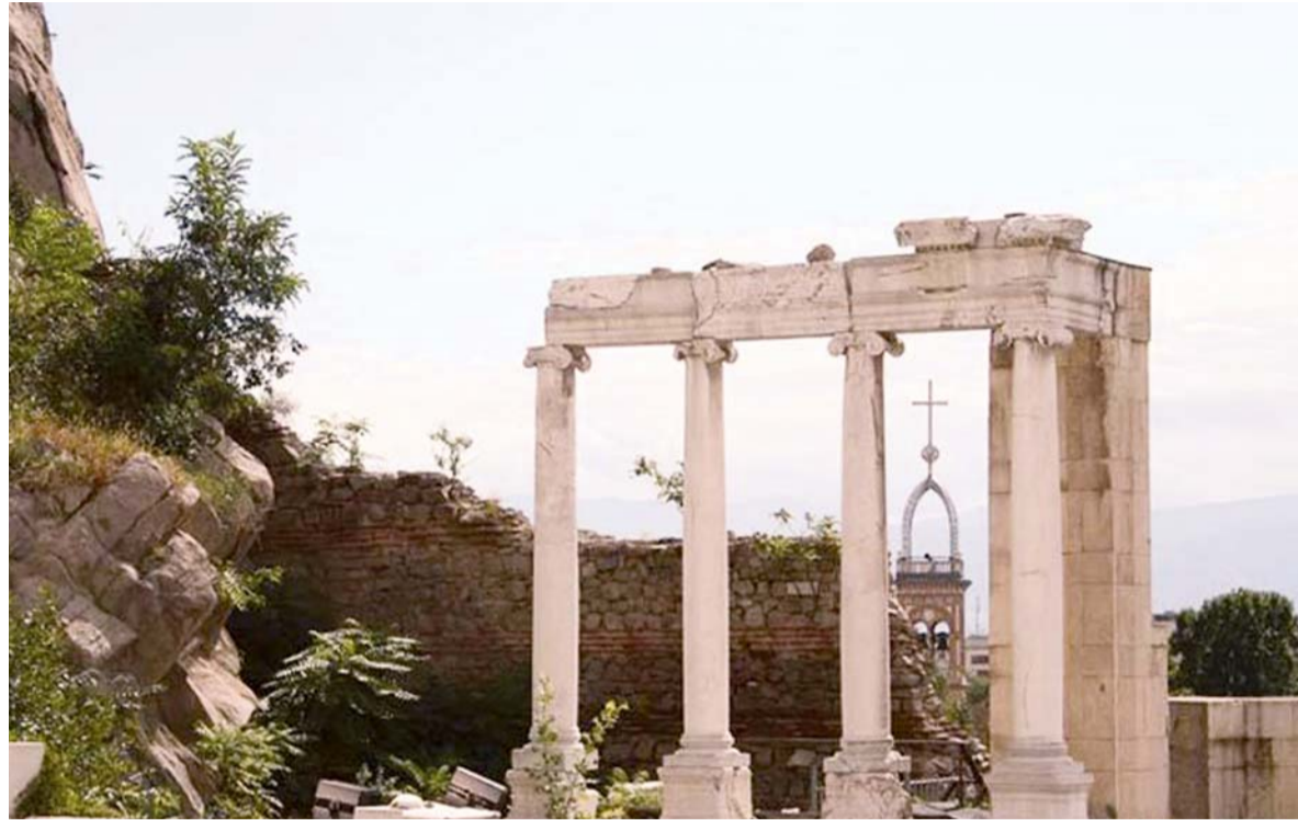
«پلوودیو، دومین شهر بزرگ بلغارستان»