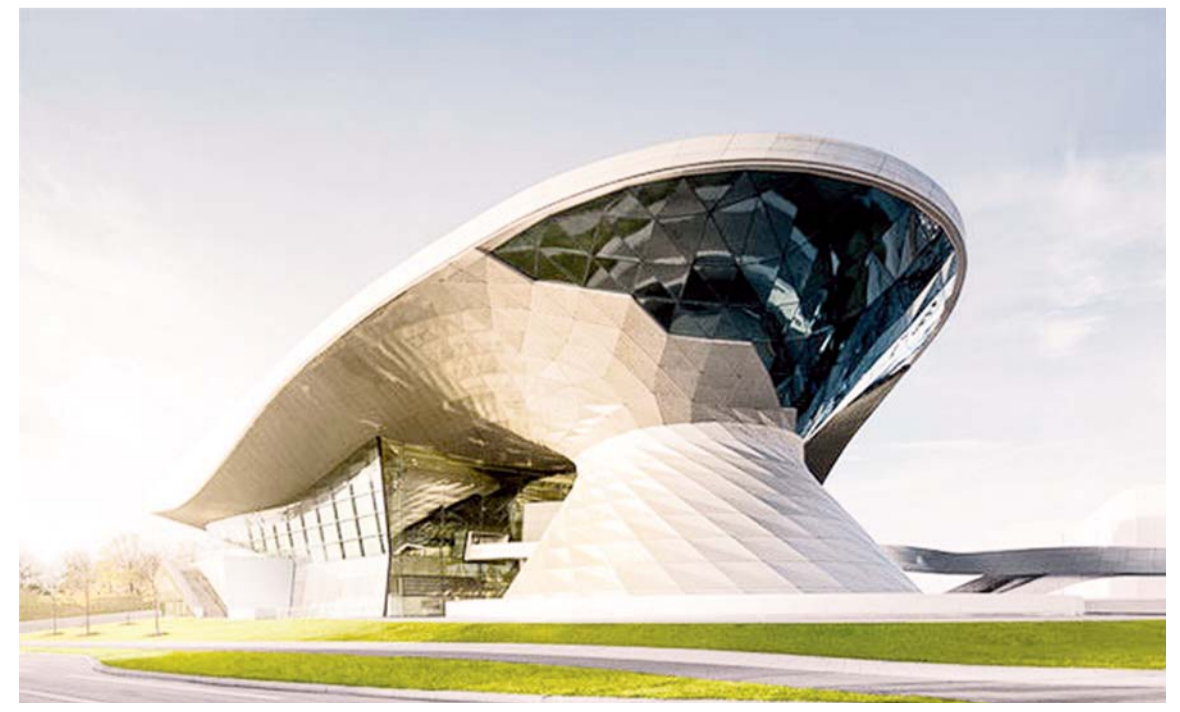
«موزه BMW، مونیخ، آلمان»