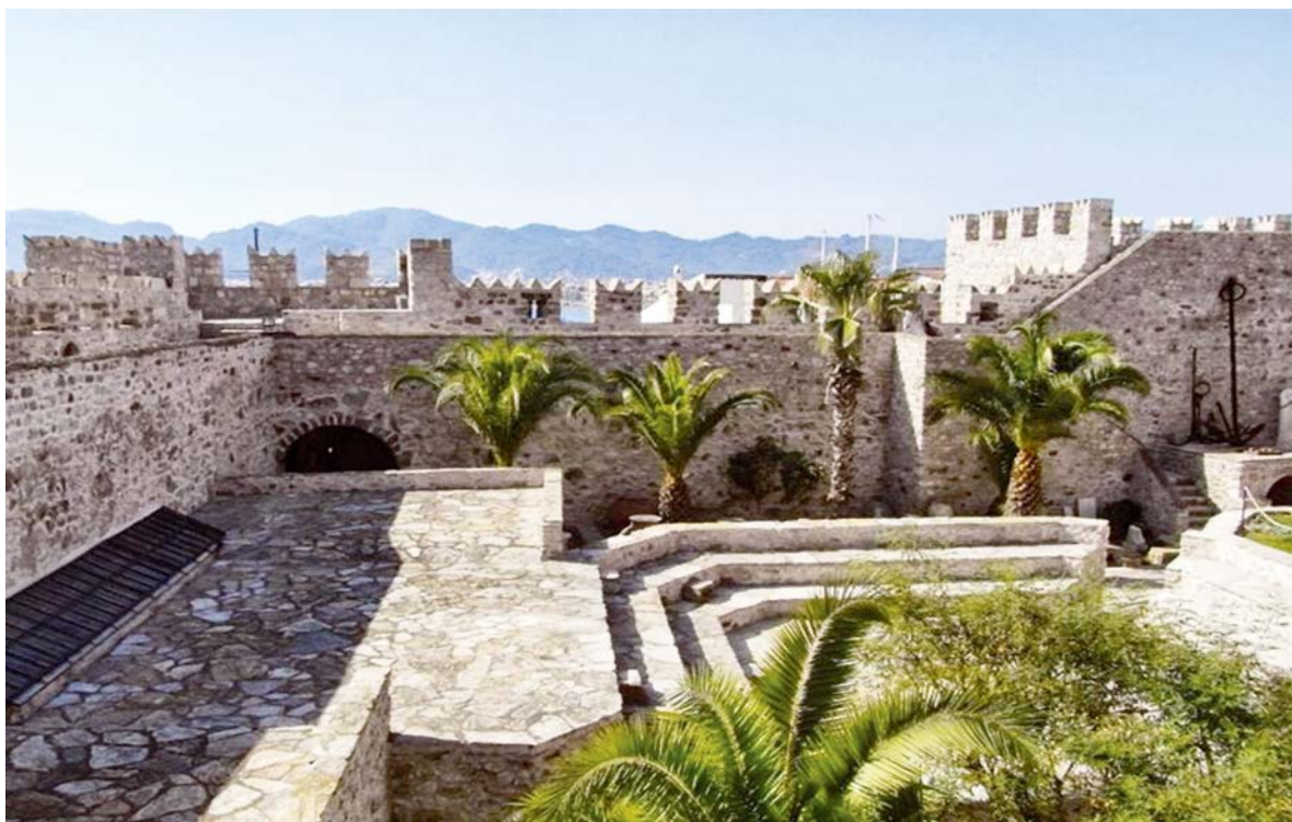
قلعه مارماریس - ترکیه